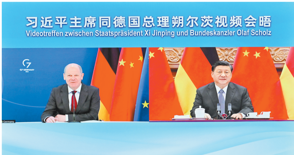
5月9日下午,国家主席习近平在北京同德国总理朔尔茨举行视频会晤。