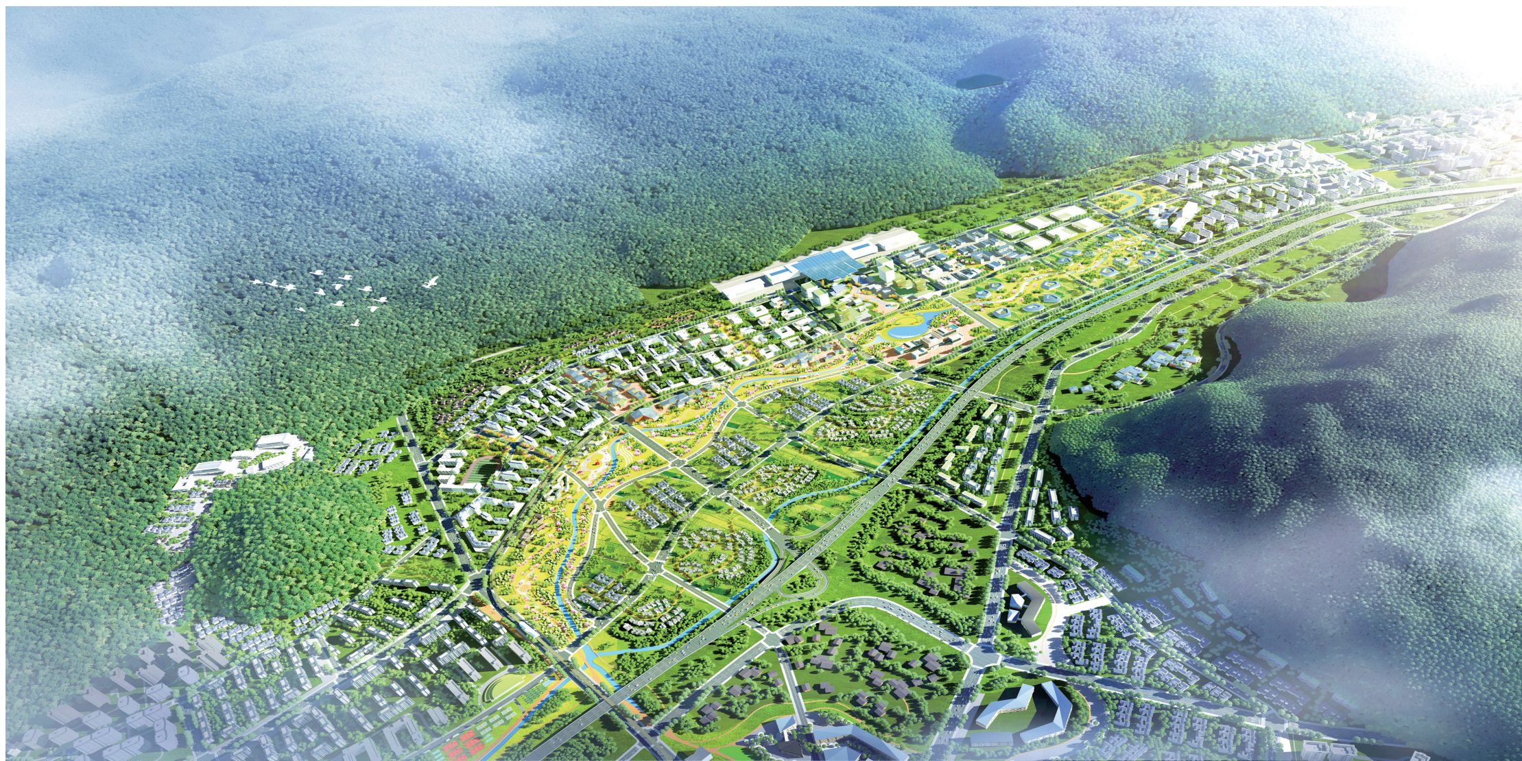
酉阳桃花源新城规划图