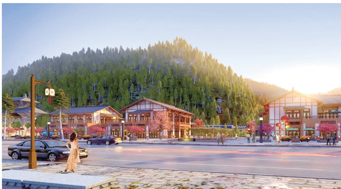
桃花源新城项目效果图