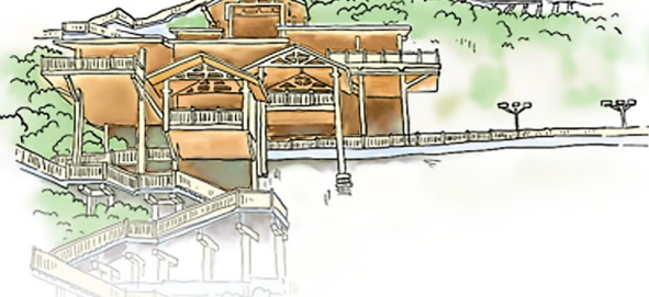
双拥口袋公园。 四月二十五日，南岸区