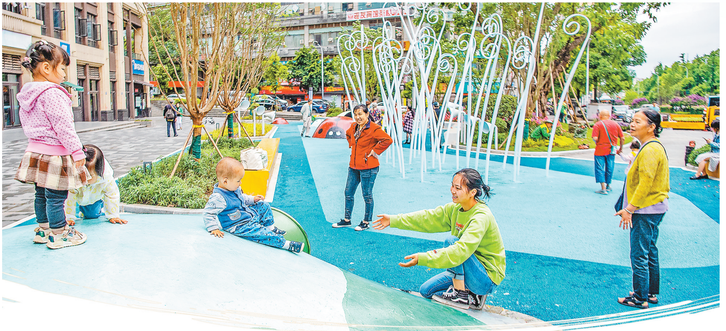
责编 陈龙华 美编 李梦妮 四月二十八日，大渡口区百花村街头游园，市民带着孩子开心玩耍。近年来，我市建设了不少口袋公园，截至四月底，仅中心城区就建成口袋公园五十余个。