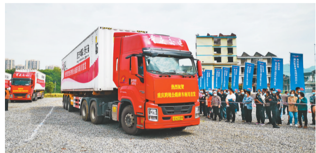
4月29日,重庆跨境公路班车在南川首发。

本报讯(记者 陈维灯)4月29日,重庆跨境公路班车在南川首发,三辆满载塑料颗粒的货车从南川商贸物流园出发,经广西凭祥口岸,两天后将到达1400公里外的越南,供当地企业加工成生活用品。这也意味着南川正式成为重庆融入西部陆海新通道跨境公路班车的区县之一。