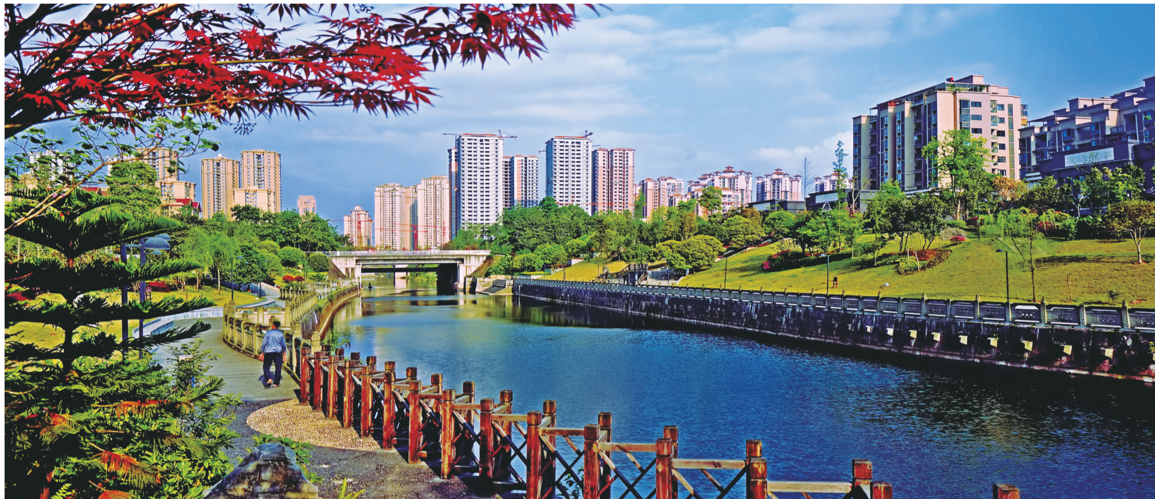
荣昌城市景观——美丽的荣峰河