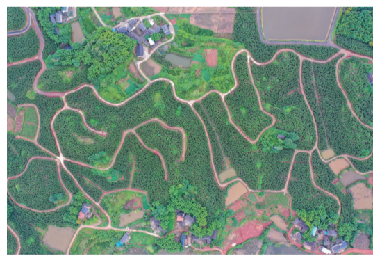
龙水镇盐河村雷竹基地广布产业路

融合发展。正在实施的“十里荷塘·山湾时光”城乡融合发展项目，依托大足石刻世遗文化符号，产城景融合发展，规划面积1万亩，通过城乡一体的道路景观等基础设施建设，打造大足大空荷莲、香国海棠景观、乡村旅游等产业，做到景中有城、城中有景、城景互动。目前，这一项目中已建成了大足乡村振兴会客厅、成渝双城荷莲农旅发展交流中心等。