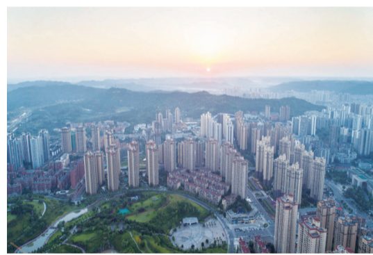
海棠新城扩容，城市功能逐步提升

目前，已形成了大足城市文化价值系统研究及大足石刻文化公园新城整体概念性策划方案，正开展大足石刻文化公园新城城市设计国际方案的征集，并力争新城建设“三年出形象，五年大变样”。