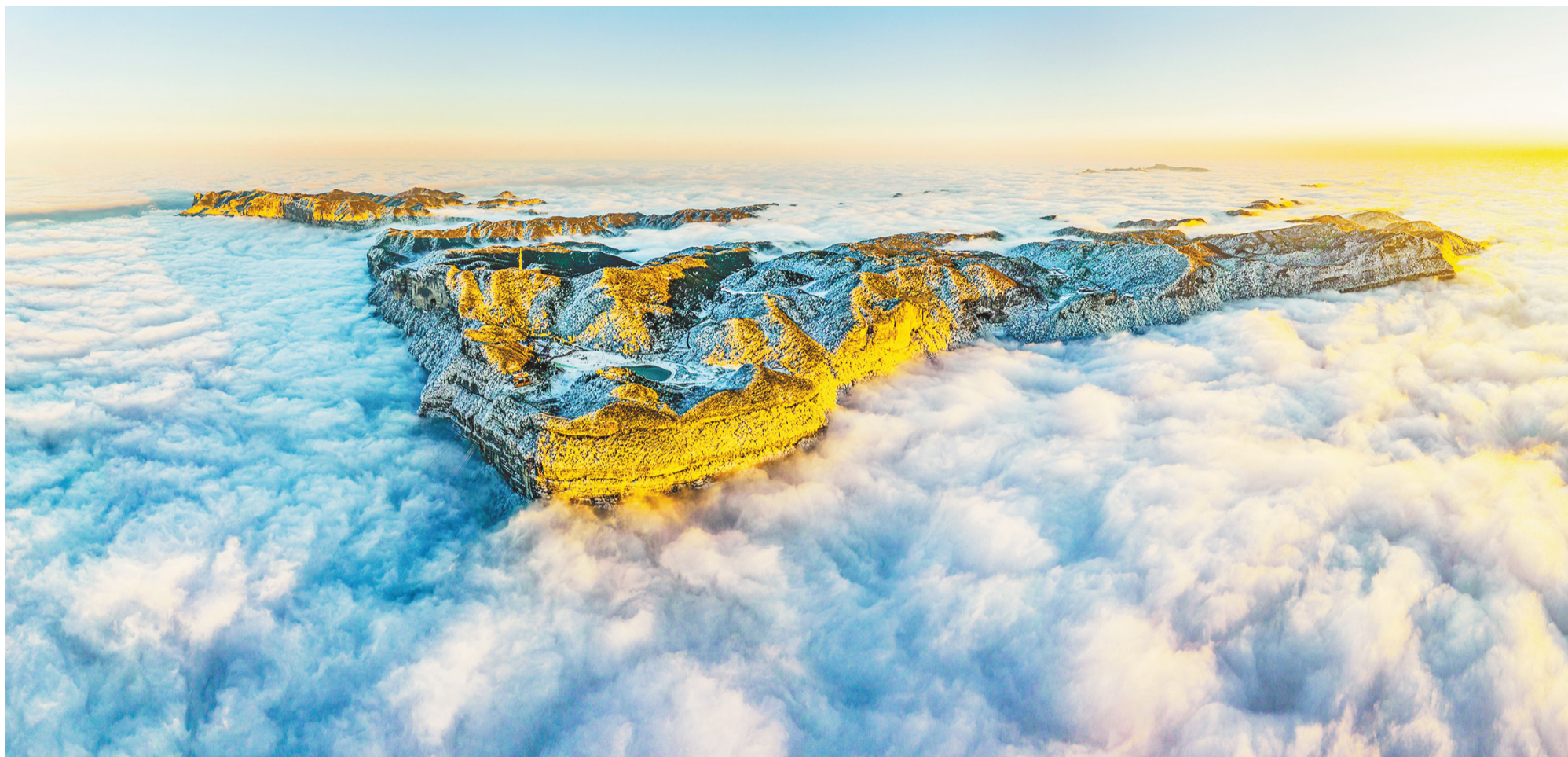
壮丽的金佛山云海景色。

近年来,南川区深学笃用习近平新时代中国特色社会主义思想,深入贯彻习近平总书记对重庆所作重要讲话和系列重要指示批示精神,在市委、市政府坚强领导下,坚持“跨越崛起、率先突破”主调,始终锁定建设同城化发展先行区目标,牢牢把握立足特色化、面向同城化“两化路径”,紧紧围绕建设山清水秀旅游名城、大健康产业集聚区、先进制造业基地、景城乡融合发展示范区、主城都市区后花园“五大定位”,奋力实施综合实力、开放水平、生态品质、民生福祉、治理效能、党的建设“六个提升”,以更加开放、更高平台、更大能级的发展迎接党的二十大和市委第六次党代会胜利召开。