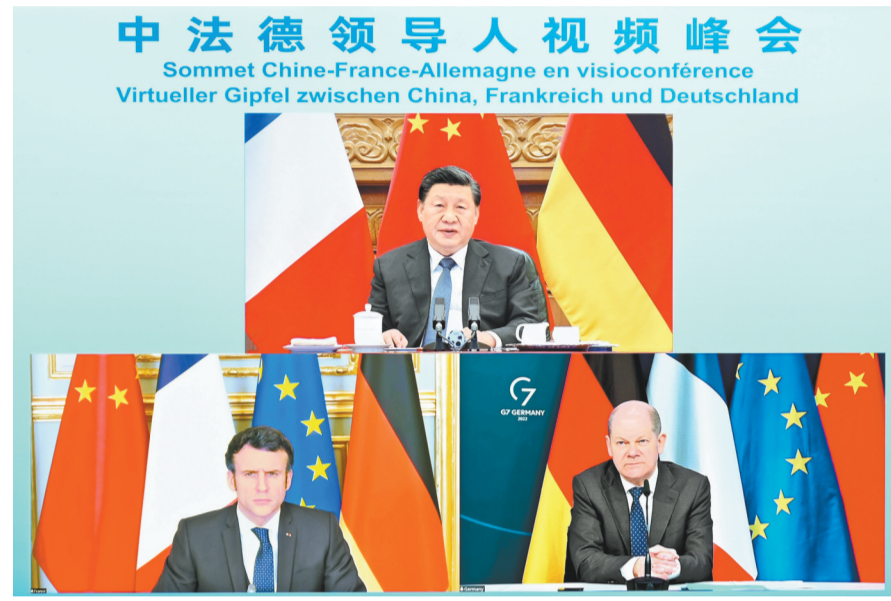
3月8日下午，国家主席习近平在北京同法国总统马克龙、德国总理朔尔茨举行视频峰会。