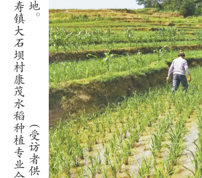
南川区福寿镇大石坝村康茂水稻种植专业合作社