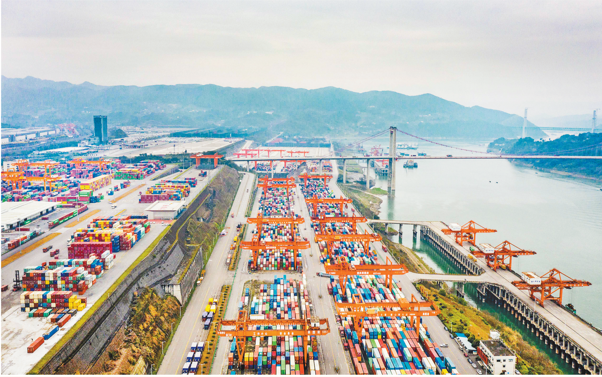
2月10日,大量集装箱整齐有序地摆放在果园港等待吊装。