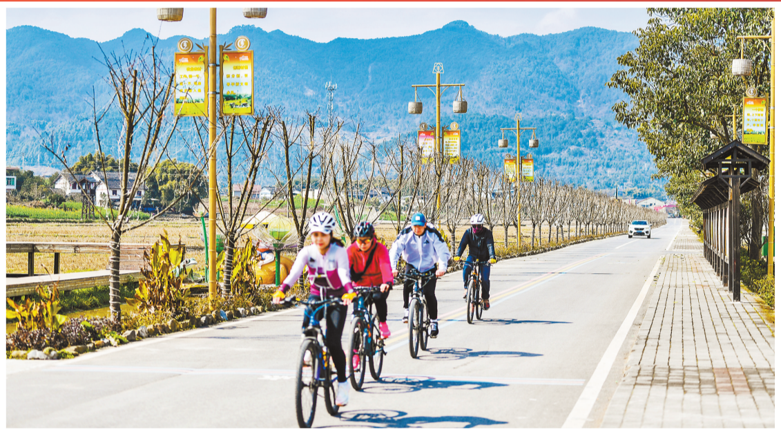
2月28日,垫江县沙坪镇羊坪村,游人在美丽广阔的乡村道路上骑行。