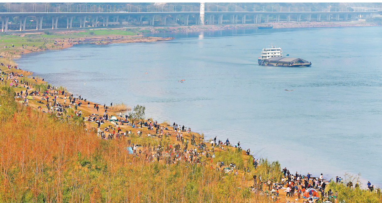
2月27日,重庆九龙坡,市民在经过生态修复后的长江九龙滩消落带休闲游玩。

展品质,努力推动高质量发展、创造高品质生活。如今,我市的颜值更高、气质更佳,市民走出家门便能体验到处处皆美景的美好。