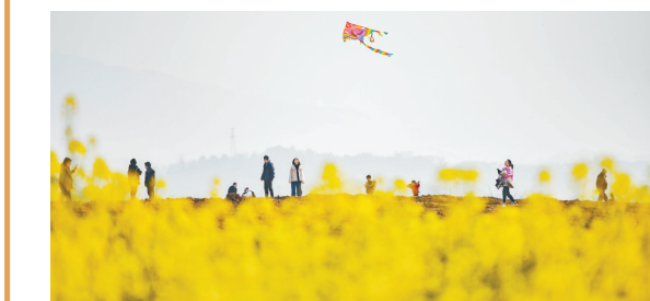
▲2月27日,重庆广阳岛,市民在油菜花田旁迎着阳光放风筝。