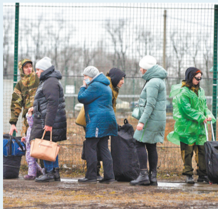
24日,来自顿巴斯地区的难民通过一处边境检查站进入俄罗斯罗斯托夫州。