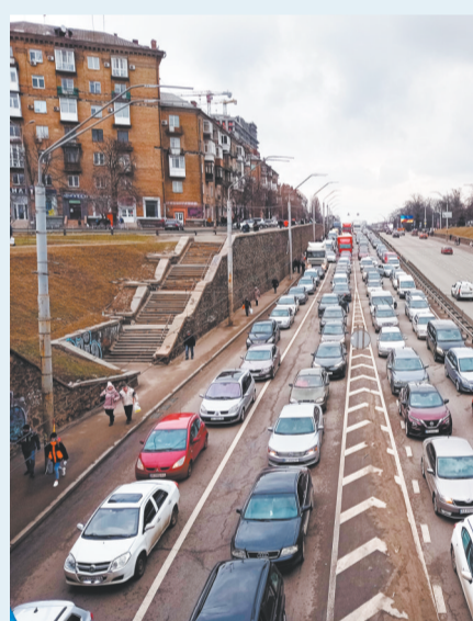
24日,在乌克兰基辅,出城方向的车辆排起长龙。