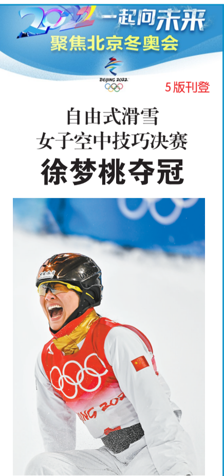
2月14日,2022北京冬奥会自由式滑雪女子空中技巧决赛举行,中国选手徐梦桃夺得冠军。