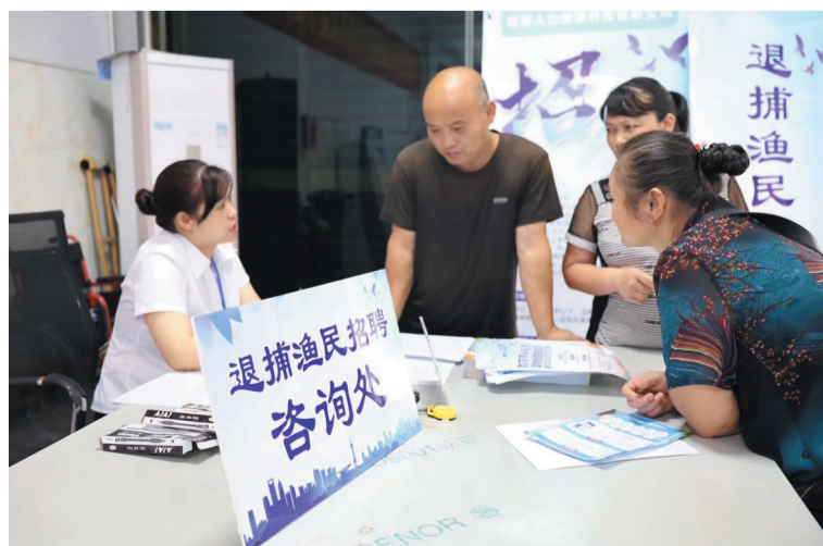
退捕渔民招聘咨询现场