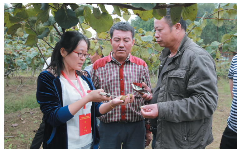
农业果树专家为村民传授技术，帮助村民就业