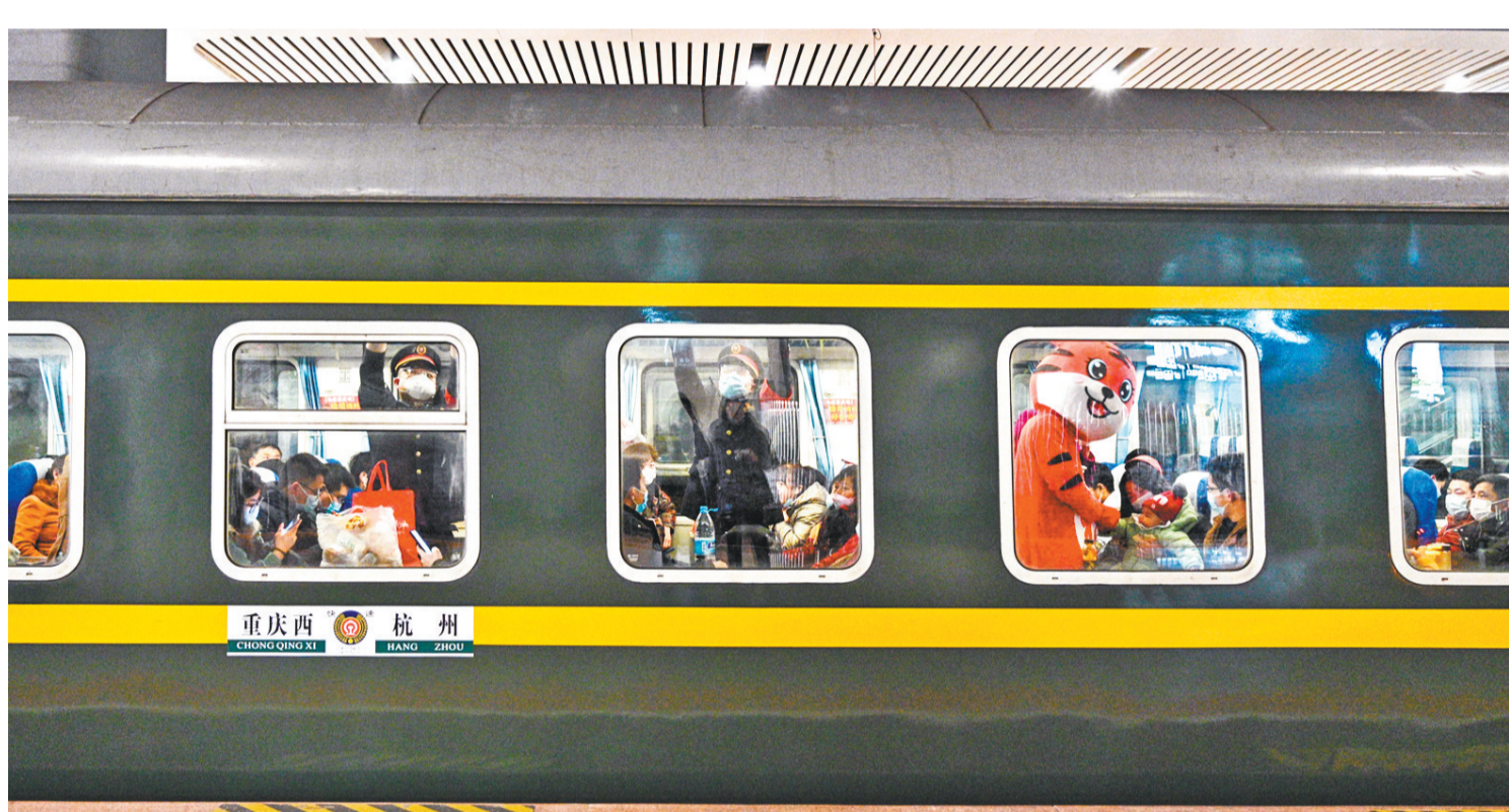
1月17日,重庆西站,春运志愿者装扮成卡通虎与出行的小朋友们热情打招呼,祝福他们新春快乐。当日是2022年铁路春运首日,重庆客运段组织青年志愿者到车厢为旅客服务,让旅客出行更温馨更便捷。