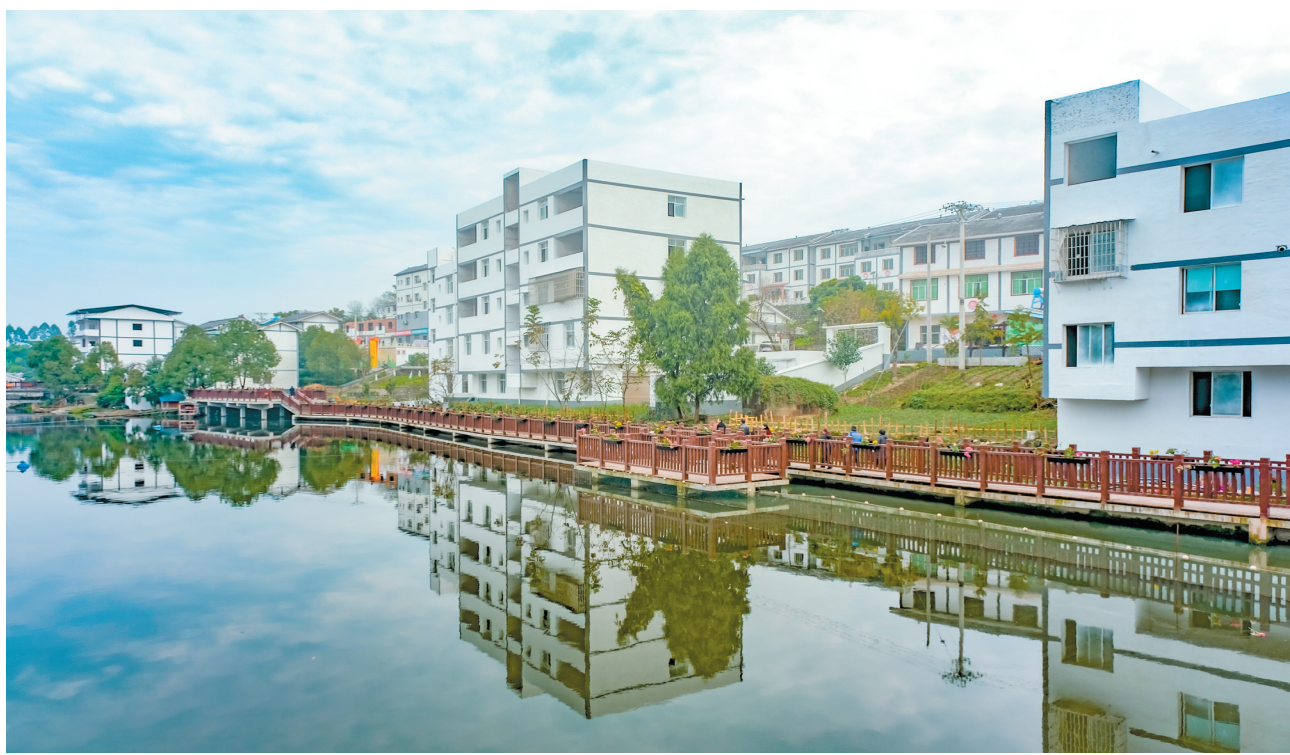
生态宜居的乡村振兴示范村——建国村

下一步,高家镇以强基础、补短板为抓手,全面推动场镇提档升级,聚力打造新型城镇化示范区。围绕“东进、