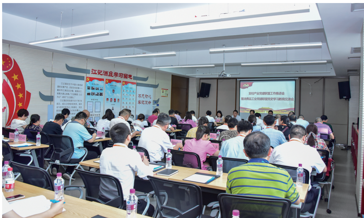
江津区支柱产业党建联盟在白沙工业园召开推介会

在实现发展共促方面,区委非公工委组织部和党建联盟成员企业从政策供给侧、需求侧“双向发力”,共同研究制定完善产业发展政