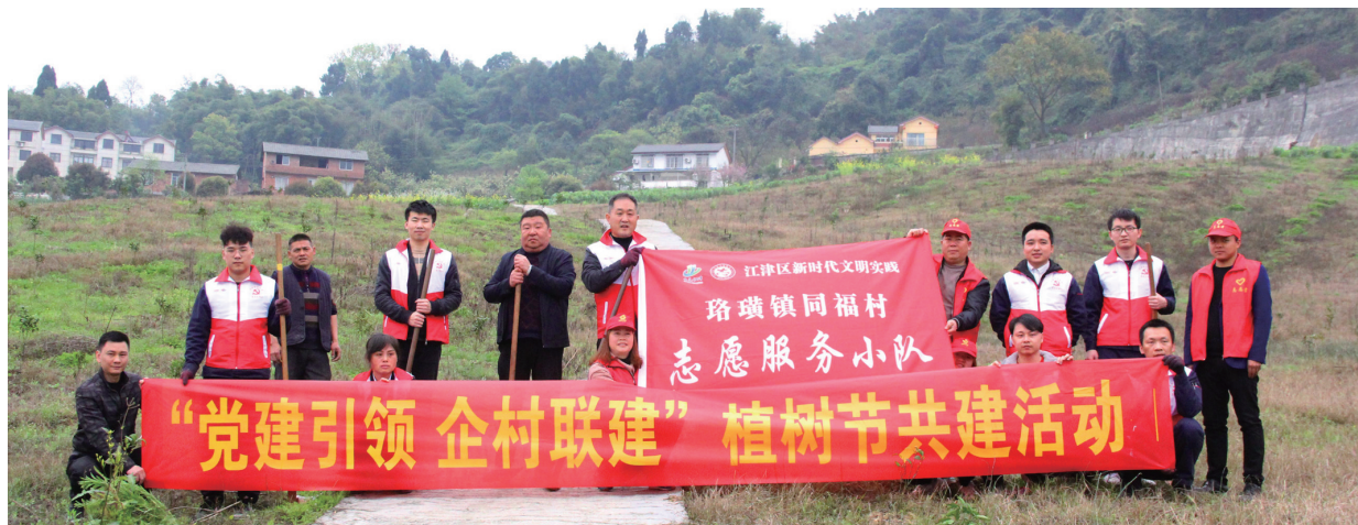
重庆三峡电线电缆科技股份有限公司同路镇同福村开展植树节共建活动