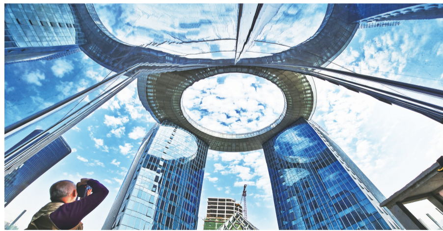
仙桃数据谷内的标志性建筑“指环王”