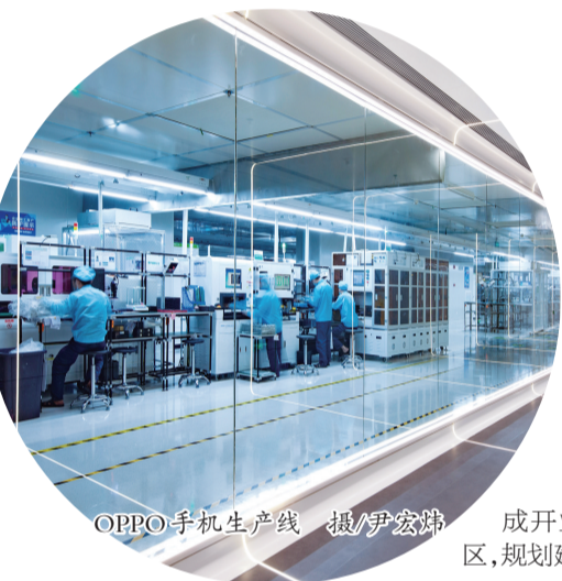
OPPO手机生产线