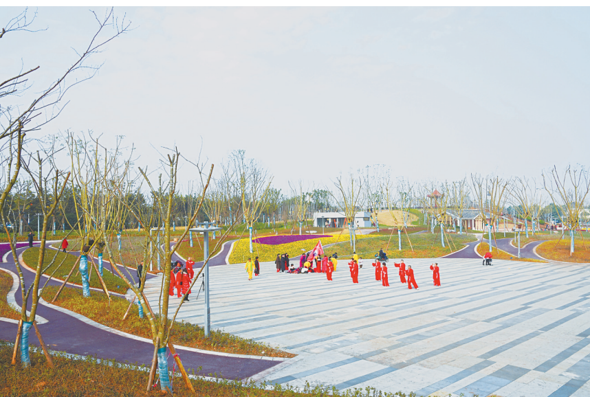
五金文化公园