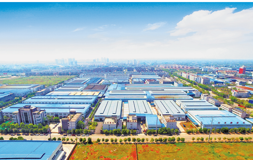
大足工业园区鸟瞰图

补齐农村基础设施建设方面的短板也是龙水镇加快城乡融合,实现乡村振兴的重要抓手。今年以来龙水镇新建6条10.7公里“四好农村路”,辖区“四好农村路”里程已达110余公里,全镇农村公路通达率、通畅率均达到100%;与此同时,龙水镇将镇域内所有农村居民全部纳入“大足区农村饮水安全巩固提升及深化脱贫攻坚户户通工程”,现已全部实现饮用水集中供水,辖区天然气管网直通到家,各行政村(社区)已基本实现电力、通讯、网络全覆盖。通过这一系列农村基础设施建设的推进,龙水镇城乡发展基础正不断筑牢。