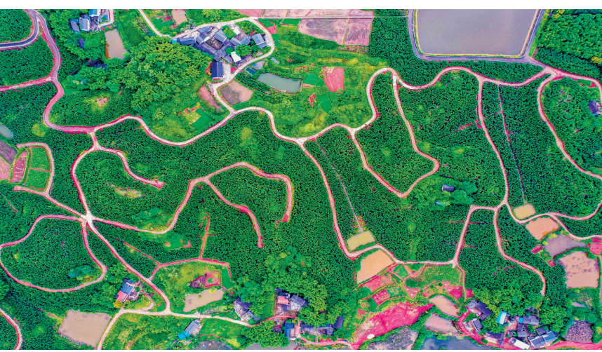
龙水镇车铺村一条条产业路连接成片的雷竹林