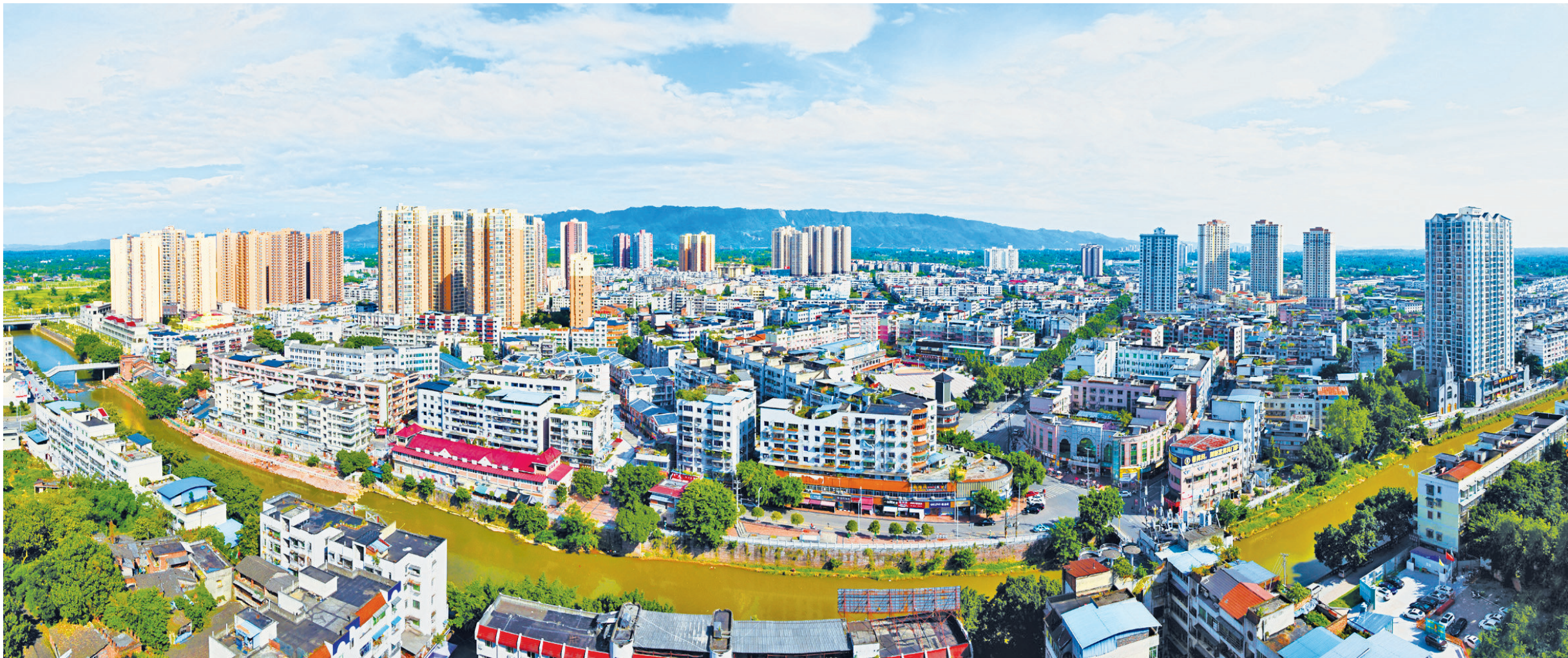
龙水镇全景图