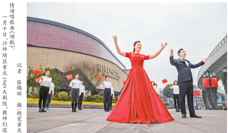
情演唱歌曲《领航》。一月十日,沙坪坝区重庆1949大剧院,教师们表演歌曲《领航》。

在百年奋斗历程中对我国社会主要矛盾和中心任务的研究和把握,是贯穿全会决议的一个重要内容,我们一定要深入学习、全面领会。面对复杂形势、复杂矛盾、繁重任务,没有主次,不加区别,眉毛胡子一把抓,是做不好工作的。我们要有全局观,对各种矛盾做到了然于胸,同时又要紧紧围绕主要矛盾和中心任务,优先解决主要矛盾和矛盾的主要方面,以此带动其他矛盾的解决,在整体推进中实现重点突破,以重点突破带动经济社会发展水平整体跃升,朝着全面建成社会主义现代化强国的奋斗目标不断前进。习近平指出,战略问题是一个政党、一个国家的根本性问题。战略上判断得准确,战略上谋划得科学,战略上赢得主动,党和人民事业就大有希望。一百年来,党总是能够在重大历史关头从战略上认识、分析、判断面临的重大历史课题,制定正确的政治战略策略,这是党战胜无数风险挑战、不断从胜利走向胜利的有力保证。(下转2版)