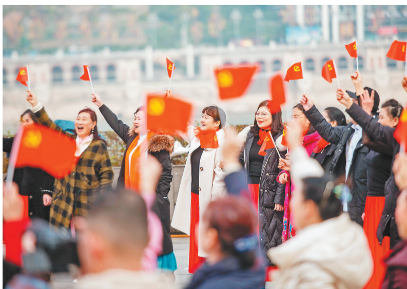
活动现场,不少在周边锻炼身体的市民也加入到了活动中。