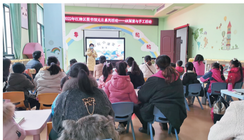
江津区图书馆元旦活动受市民欢迎

2022年1月1日至5日，江津博物馆举办了“几江藏珍——陈独秀文物特展”，展出了陈独秀旧居陈列馆馆藏文物、陈独秀先生手书《草书七言联》等藏品。展览期间，江津博物馆严格落实参观预约、限制人流等疫情防控要求，共接待5000人次观展。同时，区文化馆、区图书馆也开展了书法展、亲子阅读等活动，丰富市民假日生活。