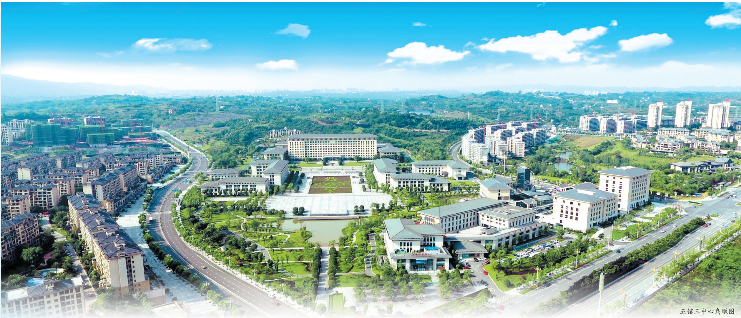
五馆三中心鸟瞰图