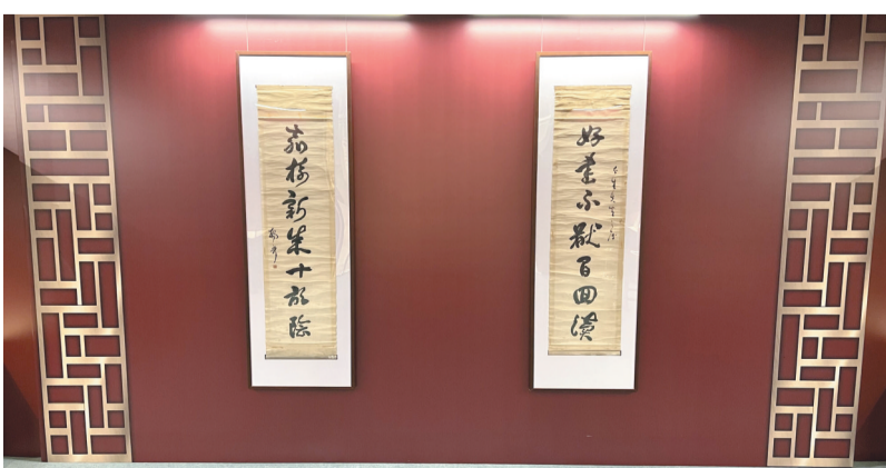
2022年1月1日至5日，陈独秀旧居陈列馆馆藏文物、陈独秀先生手书《草书七言联》在江津博物馆展出，吸引5000人次观展

加强非物质文化遗产保护传承，建立非物质文化遗产传习所9个（市级2个）、市级生产性保护基地2个、市级传承教育基地1个，新增10个市级非遗代表性项目，江津民歌《永兴吆喝》、川剧《塘河嫁》等非遗相继走上舞台，川剧《钟云舫民间故事》荣获重庆市第八届艺术节。