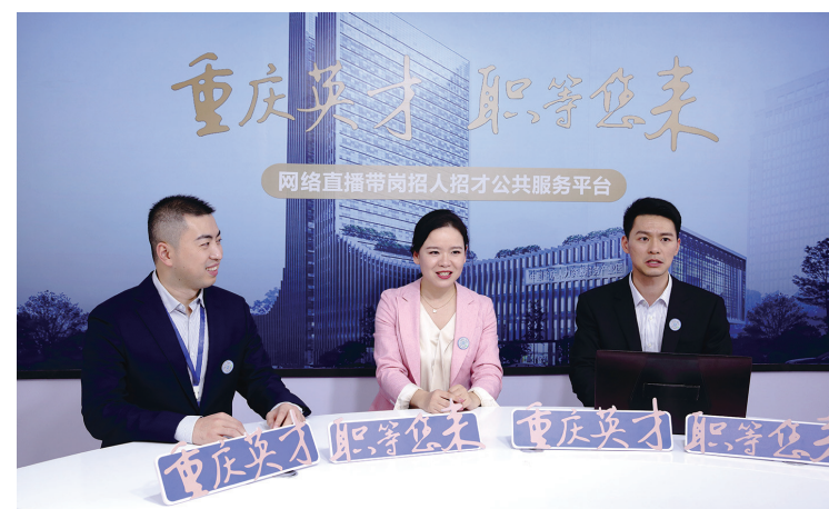
网络直播带岗招人招才活动现场