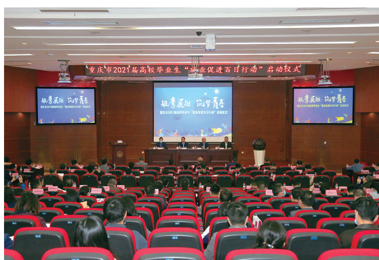
重庆市2021届高校毕业生“就业促进百日行动”启动仪式现场