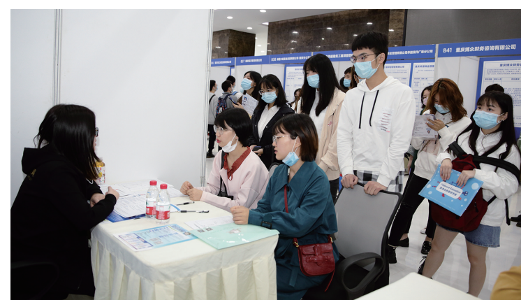
高校毕业生在就业招聘现场参加面谈