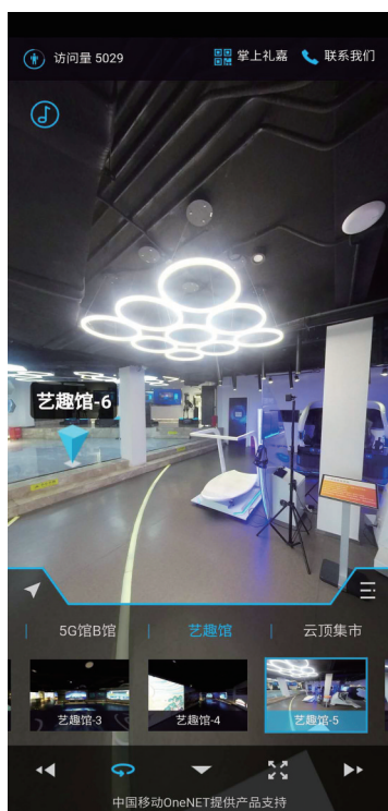
礼嘉智慧公园VR全景栏目“云游礼嘉”部分场景手机截图。

个5G技术环境下日常智慧生活的体验空间,使观众能切实感受到智慧科技即将给生活带来的改变。