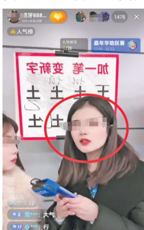
另一直播间，披肩发女孩又成了主播，要为答题女孩“讨公道”。(视频截图)