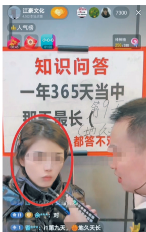
12月6日，披肩发女孩在直播间答题。(视频截图)

新重庆-重庆日报记者在线上线下连日蹲守调查发现，多个户外答题账号在进行直播时，“演员”反复出境，营造“可怜身世”人设，不仅剧情一模一样，所谓的观众答题可领红包、得福利，在一场场煽情剧本之下，转变为反复求观众打赏、刷礼物的套路，网民参与答题直播需要提高警惕。