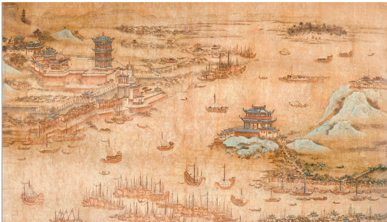
《江汉揽胜图》 作者待考 绢本设色

该作品以西方现实主义的严谨造型与浪漫主义的抒情笔调,并融合中国画的创作原理,在夸张的人物造型和细腻的人物