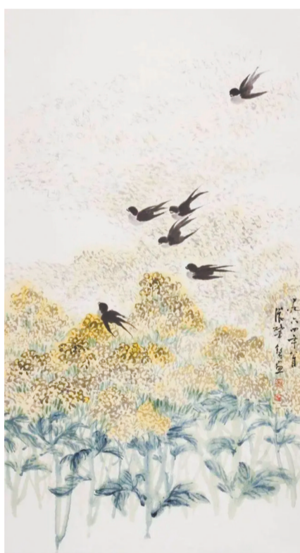
《燕子油菜花》 张肇铭 花鸟画