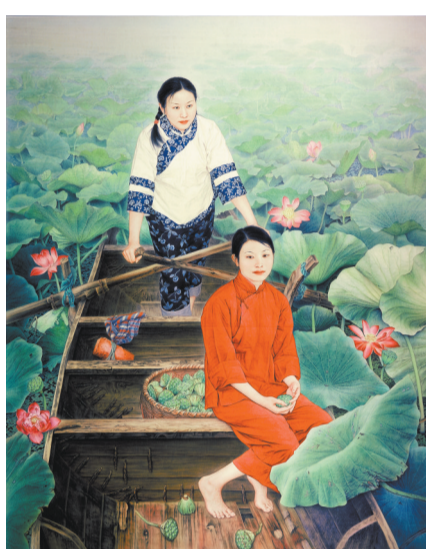
《红莲》 李乃蔚 中国画