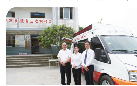
普惠金融服务车助力乡村全面振兴

让金融为人民服务、为实体经济服务，是普惠金融“大文章”的主旨。近年来，重庆银行深度融入“智融惠畅”工程，持续创新信贷产品，切实推动普惠金融服务保量、稳价、优结构，让普惠群体融资覆盖面更广、获得感更强。截至6月末，该