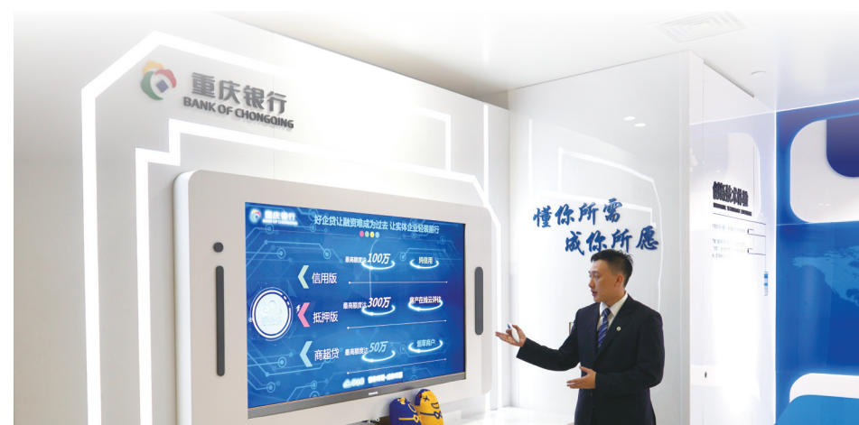
重庆银行金融科技展示区

重庆银行联合专业组织，参与中国绿金委创新案例课题研究、中国—新加坡绿色金融工作组，牵头和参与重庆绿金委5项课题研究，推出全国首个排污权抵质押融资团体标准等多个金融标准。