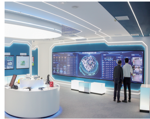
软图灵数字3D虚实展厅

在西部金融中心核心承载区打造方面，江北区的主要做法是瞄准科技金融这一新赛道，通过改革强化要素配置，提升辖区内金融类经营主体的协同性，从而产生滚雪球般的集聚发展效应。例如，前不久，该区策动重庆农村商业银行工会发起设立了重庆渝银金融科技有限责任公司，这是