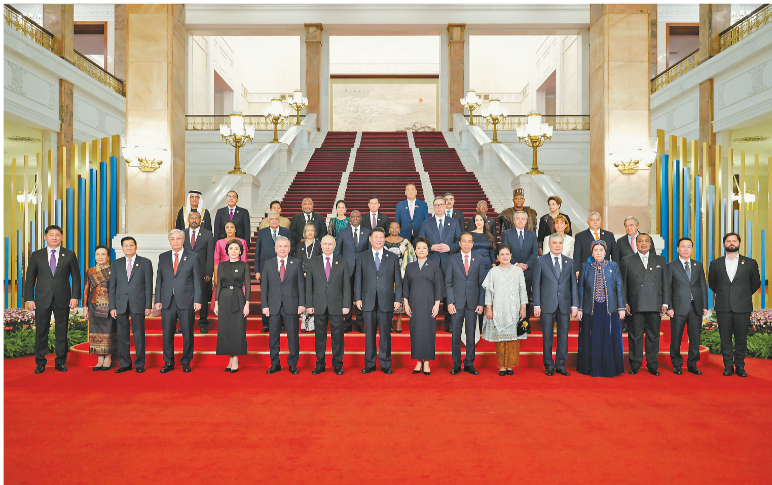
10月17日晚,国家主席习近平和夫人彭丽媛在北京人民大会堂举行宴会,欢迎来华出席第三届“一带一路”国际合作高峰论坛的国际贵宾。这是习近平和彭丽媛同国际贵宾合影留念。