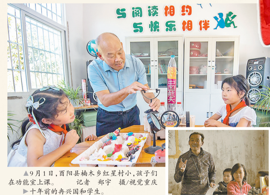
▲9月1日，酉阳县楠木乡红星村小，孩子们在功能室上课。

路，回访了当年的10名乡村教师，讲述其中“变与不变”的故事。在采访过程中，我们发现，变化的是环境，不变的是党和政府对全社会对教育事业的重视、关心和支持；变化的是人物的年纪，不变的是教育工作者对教育的那份热爱与坚守。