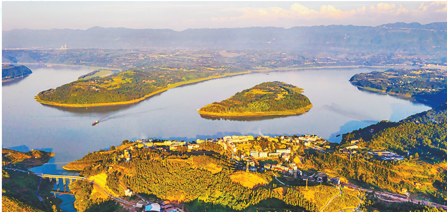
9月4日，忠县城郊，三峡库区“第一湾”宛若一幅山水画卷铺展在忠州大地。

这尊让人百思不解、疑团重重的器物，体现出其与中原文化、巴蜀文化、少数民族文化具有某种共通性与类似性，却在“形似”之下具备着无法以单一文化模式去加以周全解释的文化内涵。这，恰恰说明了中华文化本身的古老与和谐多元，也表现出中华文明的厚重与多姿多彩。它所展现的中原文化与多民族的区域文化之间的相互影响与相互融合，正是中华五千年文化的应有之义，也是对中华五千年历史的最好诠释。