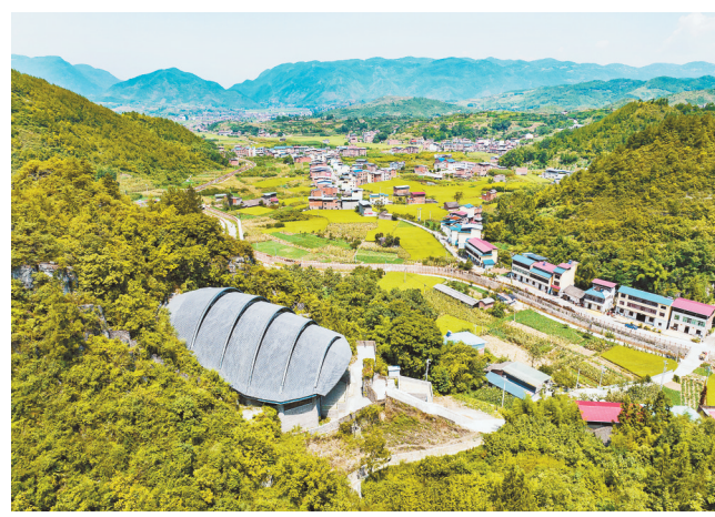
8月18日，俯瞰巫山县龙骨坡遗址。记者 谢智强 摄/视觉重庆

们洞见古今——它最早在《水经注》中称“江浦”，南宋咸淳元年(1265年)，忠州因度宗潜藩升咸淳府，移府治于皇华岛，后称“皇华城”，并作为府级治所近20年，为宋元战争山城体系的重要组成部分，也是其中唯一的孤岛型城址，距今近800年历史。