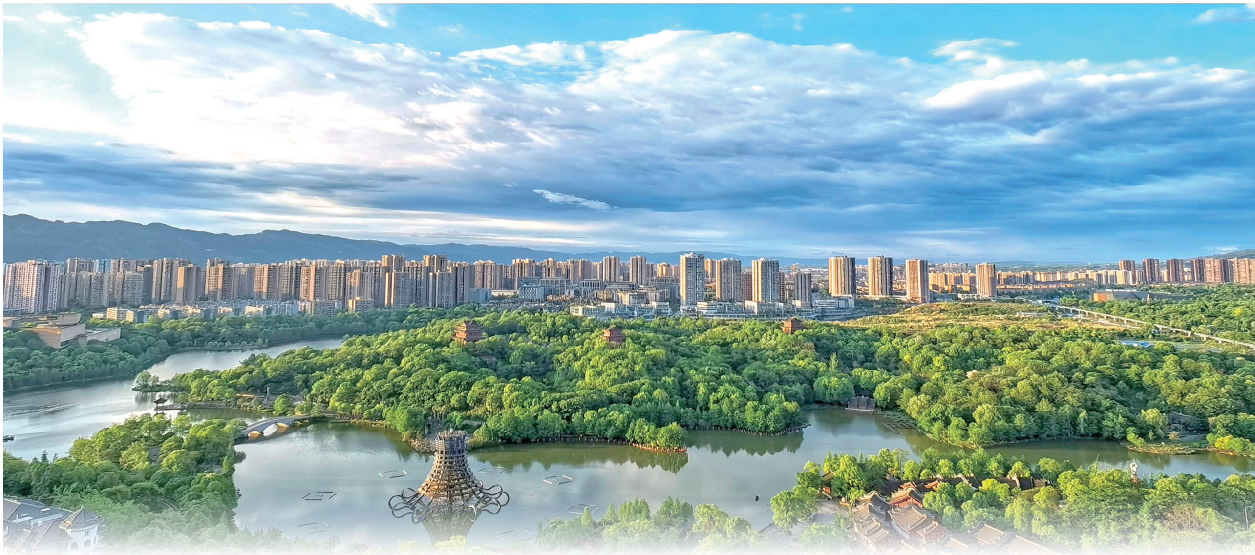
秀湖生态区