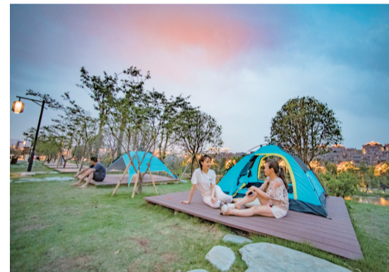
秀湖汽车露营公园

随着长征渠引水工程的提前谋划和渝西水资源配置璧山段工程、璧山城市新区水厂扩建工程的建设，璧山当前和远期供水不足的问题已经得到圆满解决。