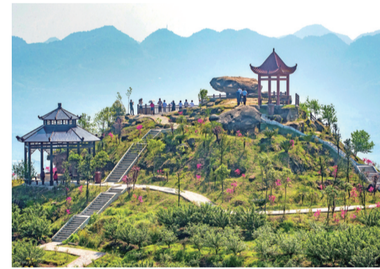
广普登云坪 摄/谢捷