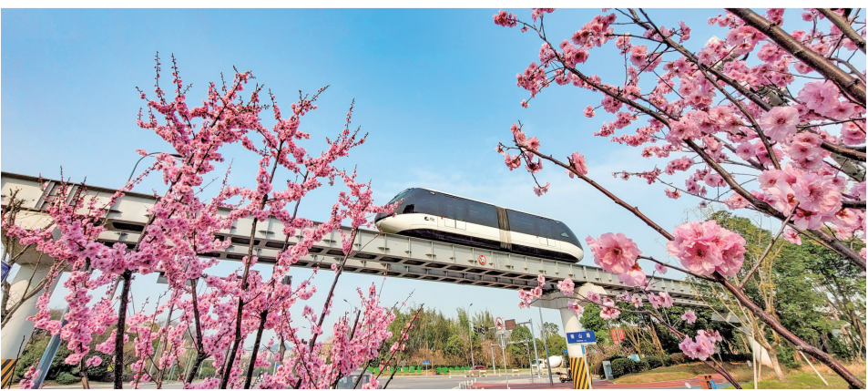
“云巴”穿行在花海中 摄/曾清龙