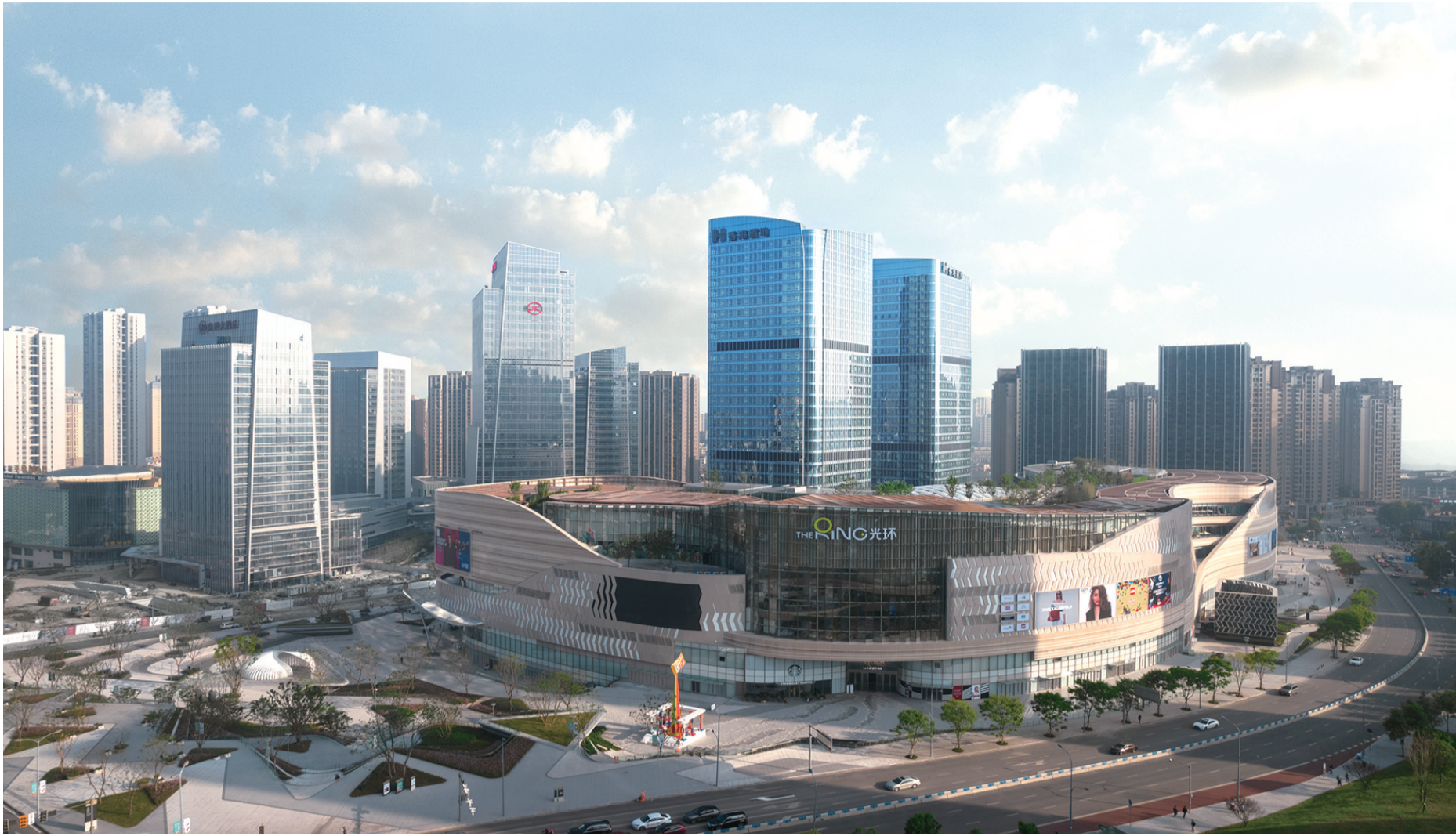
重庆光环购物公园