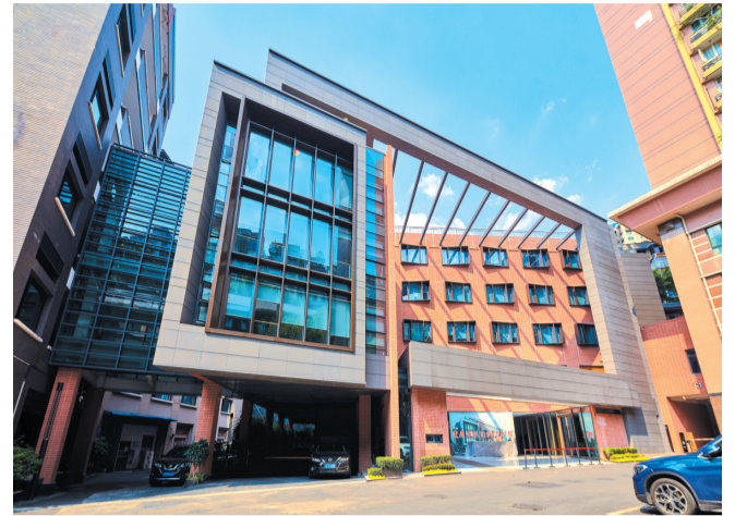
重庆市设计院建研楼