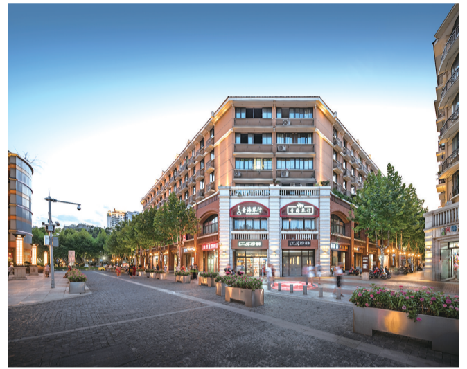
北碚南京路片区风貌改造项目